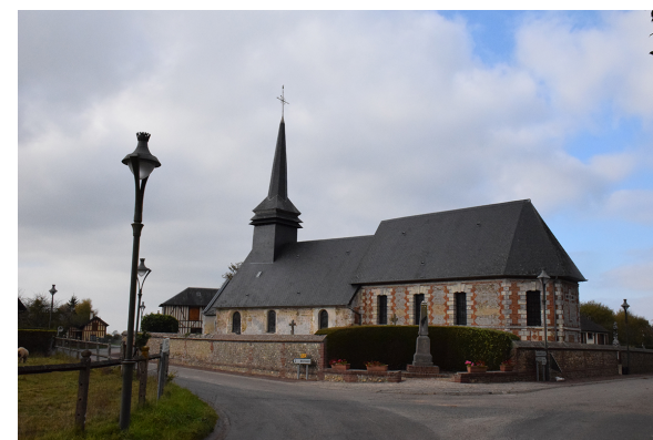
Eglise d'Asnières