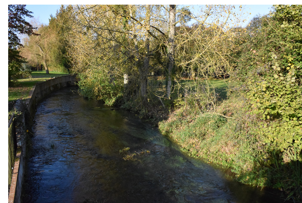
Sur le chemin des 3 calvaires