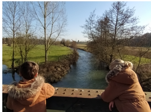
Chemin des moines2021-Vieille-Lyre

L'abbaye de Notre Dame de Lyre possédait plusieurs fermes dans la paroisse. Les moines ont probablement parcouru ce chemin pour vaquer à leurs occupations. Le logis abbatial et un mur d'enclos sont encore visibles.