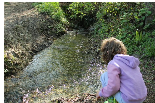
Enfant jouant sur la véronne

Le village de Saint-Etienne-l'Allier fut le berceau du maquis Surcouf qui compta 300 combattants armés à la Libération pour soutenir les alliées. Ce réseau, le plus important en Haute-Normandie, naquît de la volonté de Robert Leblanc, cafetier du village, et de l'abbé Meulant qui en était le curé. Un monument a été élevé à l'entrée du village à la mémoire des combattants du maquis et des habitants de la région tués par les allemands.