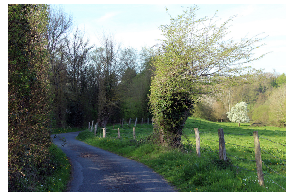
Chemin du caillou marais