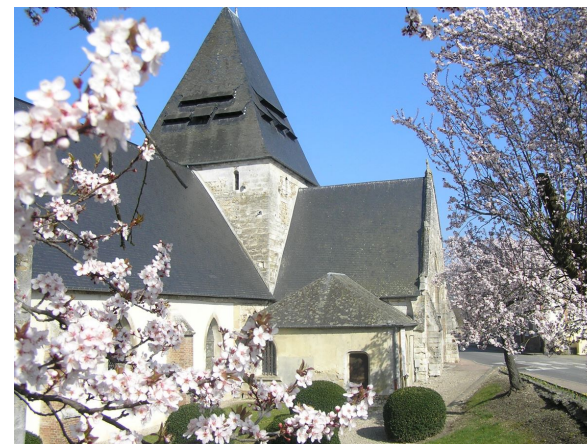
Eglise St Philbert

Sur le mur intérieur Sud de la nef, une fresque polychrome raconte la vie de Saint-Ouen, évêque de Rouen et contemporain de Saint-Philbert. Datée du XVe siècle et inscrite à l'Inventaire Supplémentaire des Monuments Historiques, cette fresque a été intégralement restaurée en 2000.