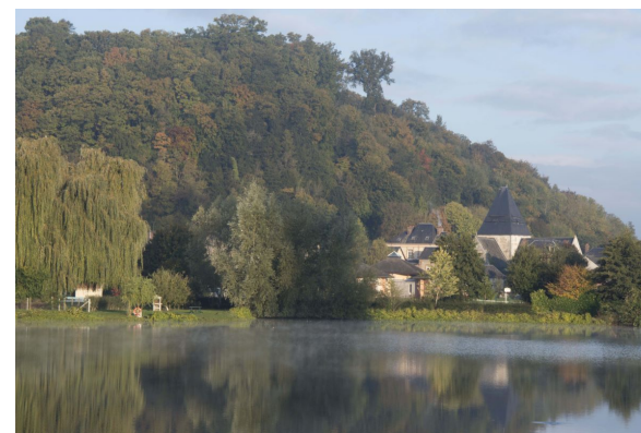
Lac de Saint-Philbert sur Risle