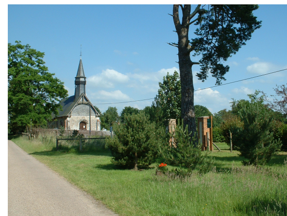
Eglise de Barville

Six aviateurs âgés d'une vingtaine d'année (3 canadiens et 3 britanniques) sont enterrés dans le petit cimetière de Barville. Leur avion a été abattu par la DCA allemande en 1944 au dessus du village où les allemands avaient installé un champ d'aviation