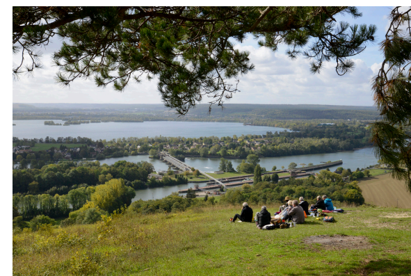
2019-08_Randonnée Cote des 2 amants 12