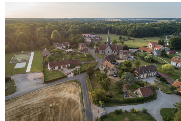
Fossés royaux-St Christophe-sept2018

C'est Henri II Plantagenêt, duc de Normandie et roi d'Angleterre, qui a ordonné la construction de cette fortification venant compléter la ligne de châteaux existants, déjà renforcée sous le règne de Henri Ier Beauclerc. Le tracé initial comptait 105 km de long. La terre enlevée pour creuser le fossé (3 à 9 m de profondeur) était rejetée côté Normandie pour former un talus haut (5m) donc infranchissable.