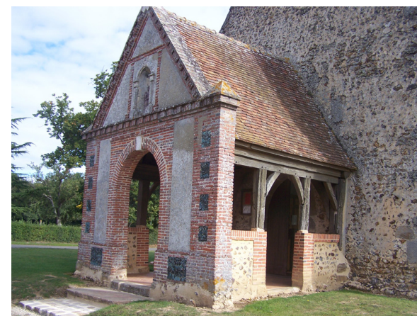
Eglise St Christophe