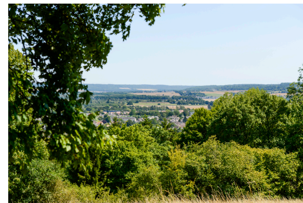
2019-08_La porte aux chiens à Villers sur le Roule 17

Le Château de Gaillon est un lieu stratégique au XIIe siècle, rasé partiellement en 1424, la seigneurie de Gaillon est relevée à partir de 1459 par Guillaume d'Estouteville. De 1498 à 1509, Georges Ier d'Amboise, cardinal archevêque de Rouen, métamorphose l'ancienne résidence d'été de ses prédécesseurs en un château grandiose et fait de Gaillon un foyer de rencontre entre l'art gothique flamboyant et celui de la Renaissance. Le passage d'un style architectural à l'autre a laissé des traces encore visibles.