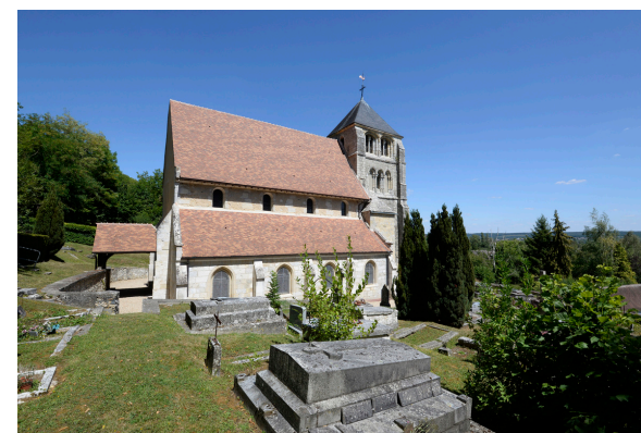
2019-08_La porte aux chiens à Villers sur le Roule 4