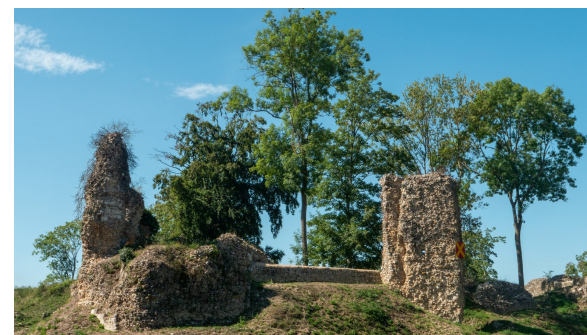
Département de l'Eure - Stéphane Coutant