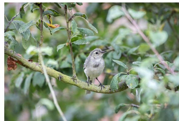
Massif forestier-oiseaux-sept2019