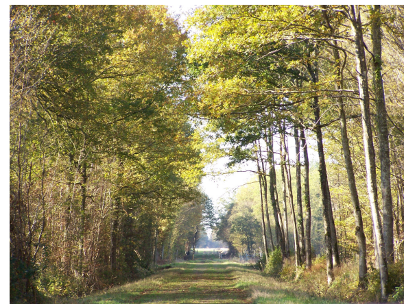
Massif forestier

Cette boucle vous emmène au cœur de l'un des plus grands ensembles forestiers de Normandie : la forêt de Breteuil et celle de Conches. Au cours de votre balade, vous emprunterez une partie du GR 222 (itinéraire reliant Verneuil-sur-Avre à Pont de l'Arche sur 137 km). Une marche agréable à l'ombre de cette belle chênaie-charmaie.