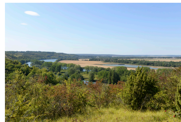
2019-08_Les coteaux d'Heudebouville 2

Présente sur les coteaux, l'Orchis Pyramidale peut atteindre 50 cm de hauteur, avec des couleurs variées du rose pâle au rouge très foncé. Sa floraison a lieu de mai à juillet. La forme pointue de son inflorescence en début de floraison, a donné son nom à l'espèce.