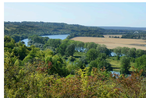
2019-08_Les coteaux d'Heudebouville 3