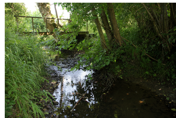
Sentier de la biodiversité 1

Affluent de la Calonne, le douet Tourtelle prend sa source à Saint-Sylvestre-de-Cormeilles. Dans le cadre d'un programme complet de réhabilitation du bassin de la Calonne, le douet Tourtelle a été récemment remis en état : nettoyage des berges et des embâcles, restauration du biotope, mise en conformité des bâtiments d'élevage... Ces petits ruisseaux intermittents sont appelés « douets » aux alentours de Cormeilles.