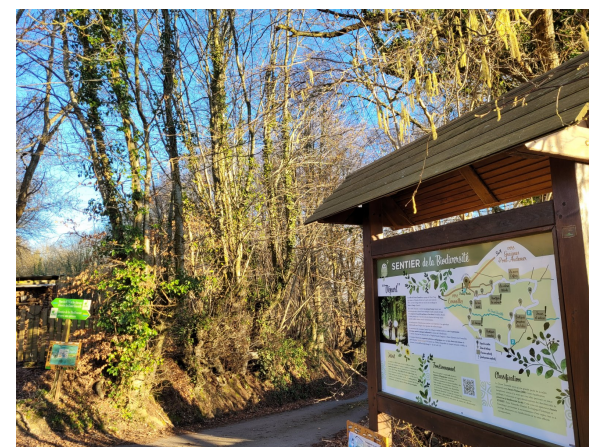
Sentier de la biodiversité