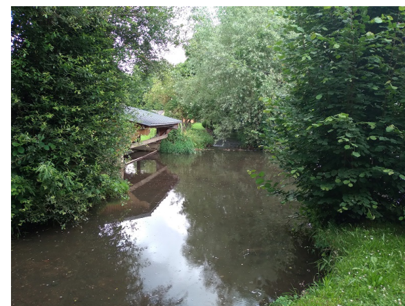
Lavoir de Saint-Elier

Les célèbres verrières du chœur de l'église Ste -Foy constituent un exemple unique en France de l'art verrier du XVIe siècle et témoignent de la richesse de cet art dans l'Eure, qui compte plus de 6 000 m2 de verrières antérieures à la Révolution. Conches est aussi la patrie du maître-verrier François Décorchemont (1880-1971), artiste novateur reconnu pour sa technique unique appliquée à l'art du vitrail.