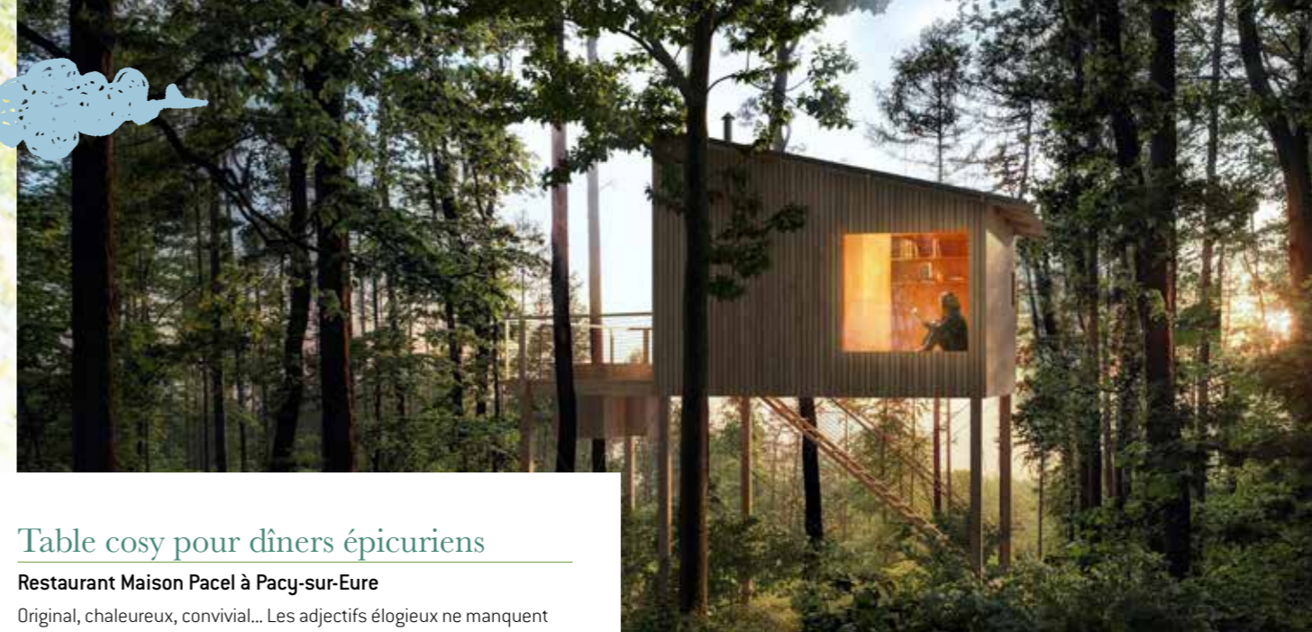
Table cosy pour dîners épicuriens